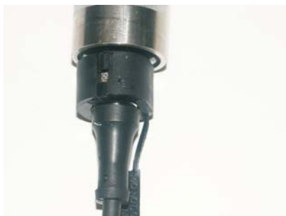
Bild 2 Zusammengepresste Halbschalen