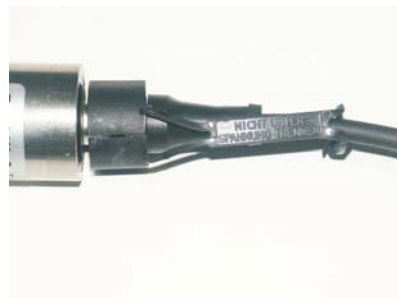
Bild 3 Fertig montierte Hülse